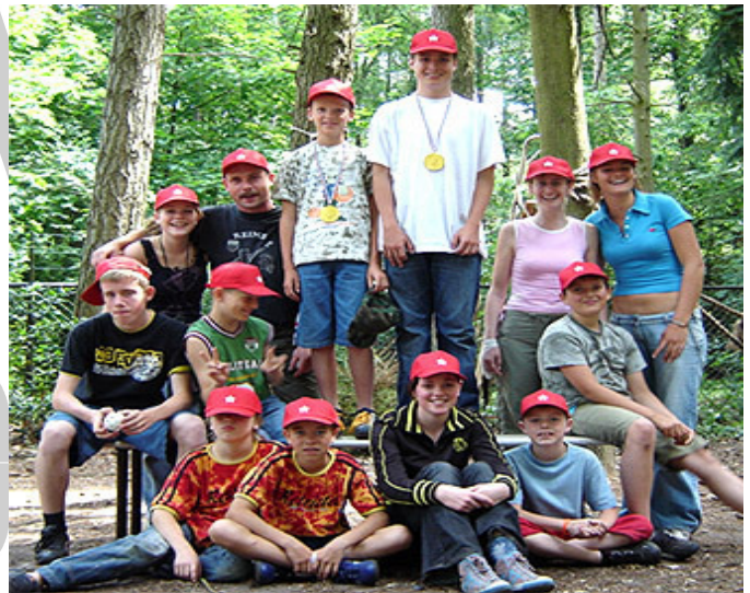
De deelnemers aan het jeugdweekend.

den de jongens bedankt en kregen van Martijn een stapel kaarten met NBA basketballers. Met de tong `achter' de schoenen aan slepend werden de trainers bedankt en gingen de jongens richting kleedkamer. Hier wachtte een verfrissende, iets wat lage "kiekeboe" douche. Moe maar voldaan op naar de volgende kamp activiteit.